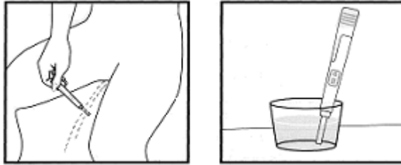
Vizeletsugaras módszer Vizeletgyűjtés